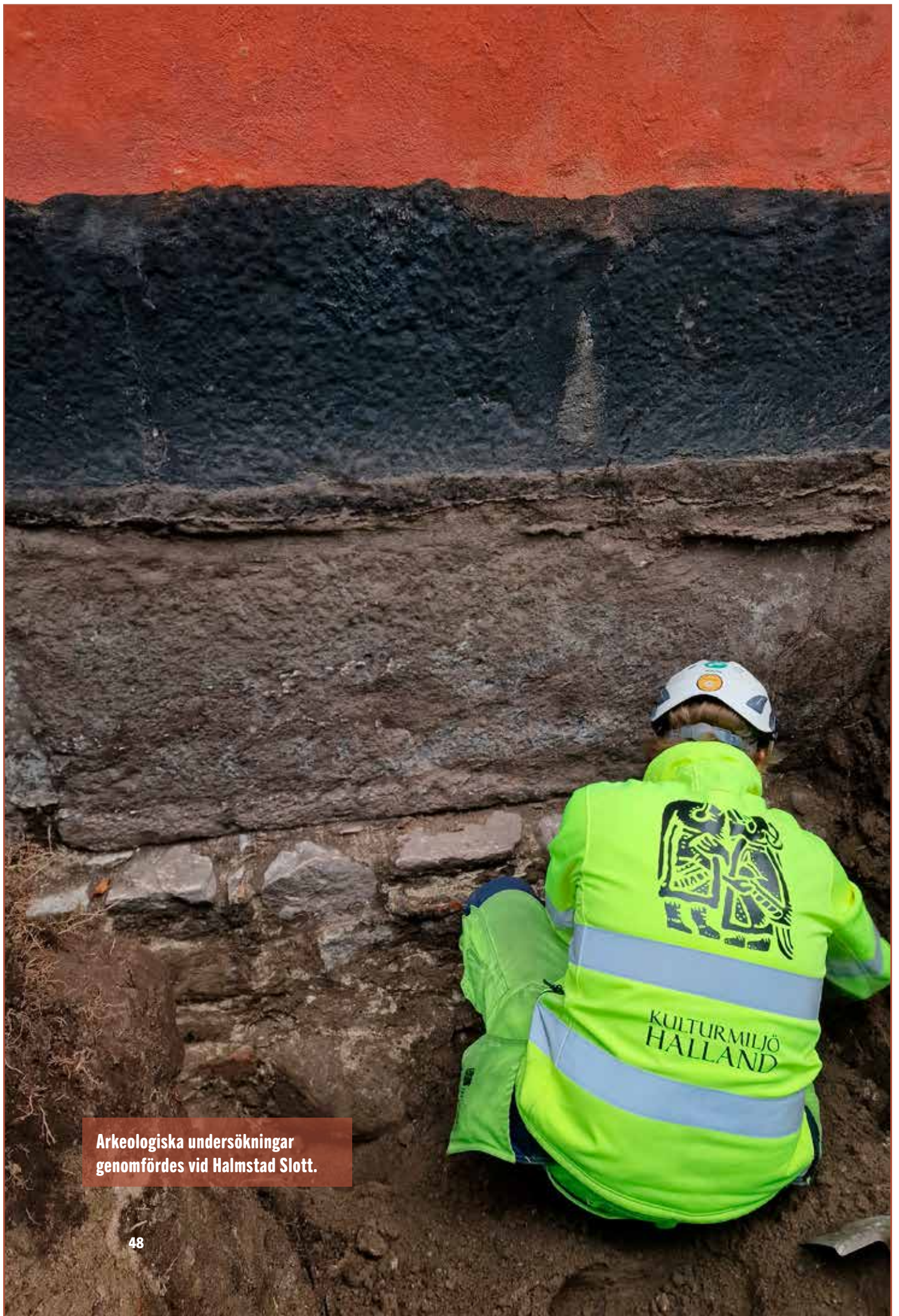
Arkeologiska undersökningar genomfördes vid Halmstad Slott.