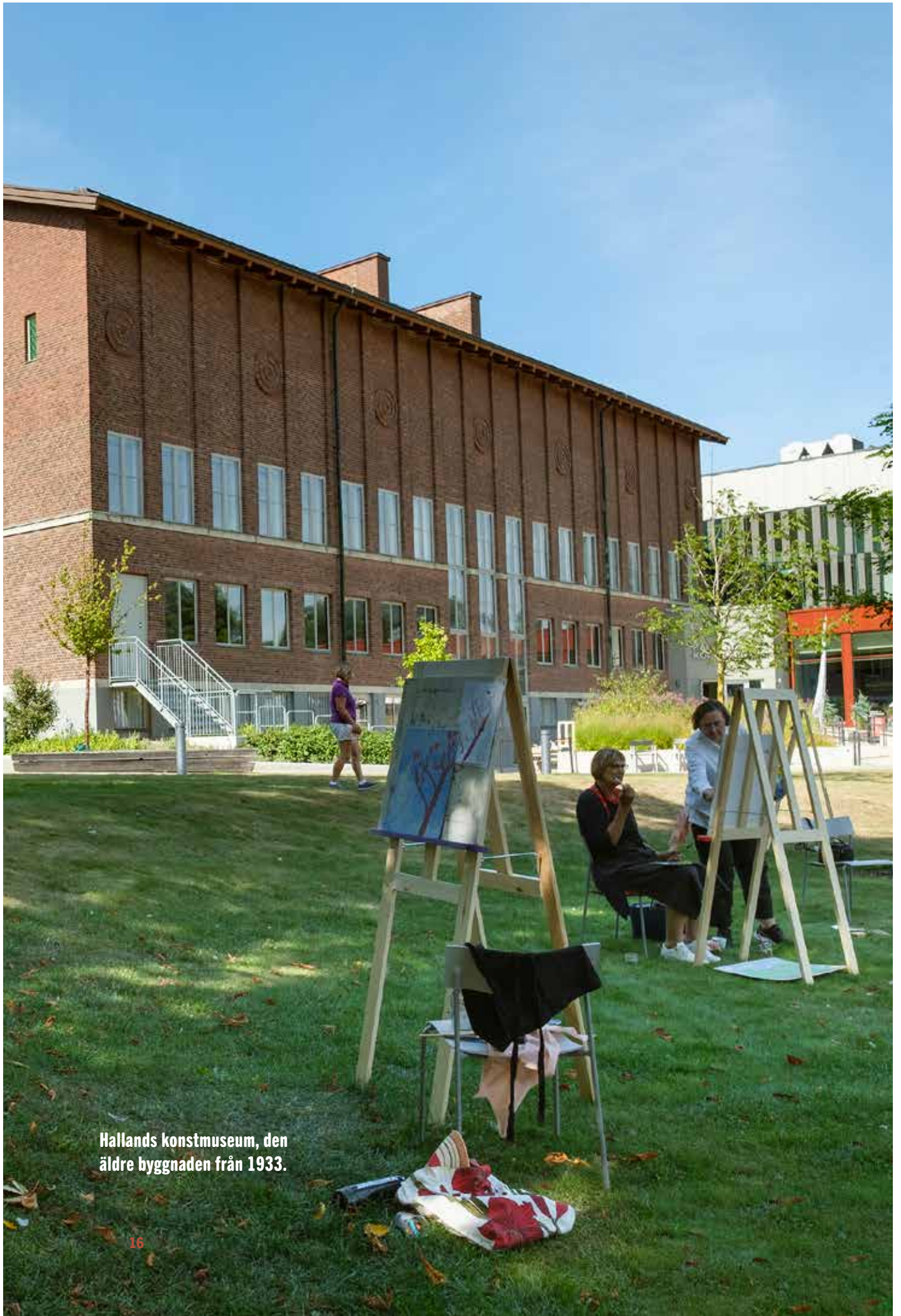
Hallands konstmuseum, den äldre byggnaden från 1933.