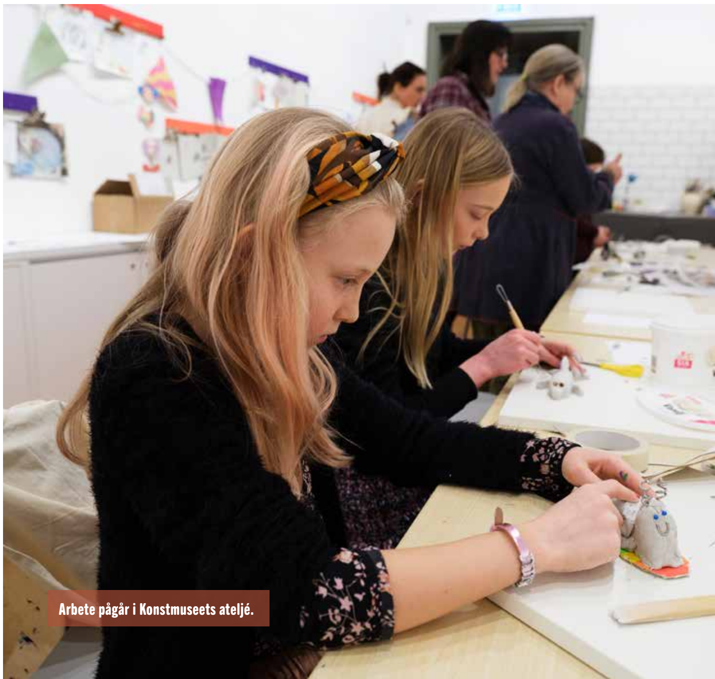
Arbete pågår i Konstmuseets ateljé.

Familjeaktiviteter i form av lekfulla upptäckarpaket har erbjudits såväl i samlingsutställningen Gränsländ som i museets trädgård. Konstmuseets ateljé har varit öppen varje helg, obemannad men med programupplägg för eget skapande.