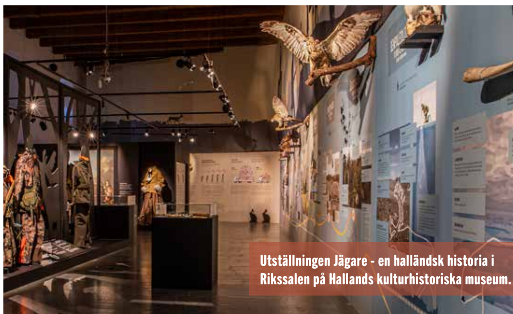
Utställningen Jägare - en halländsk historia i Rikssalen på Hallands kulturhistoriska museum.

Under hösten 2022 öppnade museet den egenproducerade utställningen Jägare – en halländsk historia . Utställningen berättar om natur, djur, vapen, slakt och makt; hur växt- och djurliv har förändrats och vem som har fått jaga i den halländska naturen från istid till nutid. Med fokus på klimatkrisen kartläggs vilka växter och djur som kommer att stanna eller försvinna från Halland om klimatet blir varmare. Jakt är idag en mycket populär fritidssyssla och folkrörelse med över 10 000 jägare i Halland. Utställningen öppnades i Rikssalen 15 oktober 2022 och visas till 1 oktober 2023.