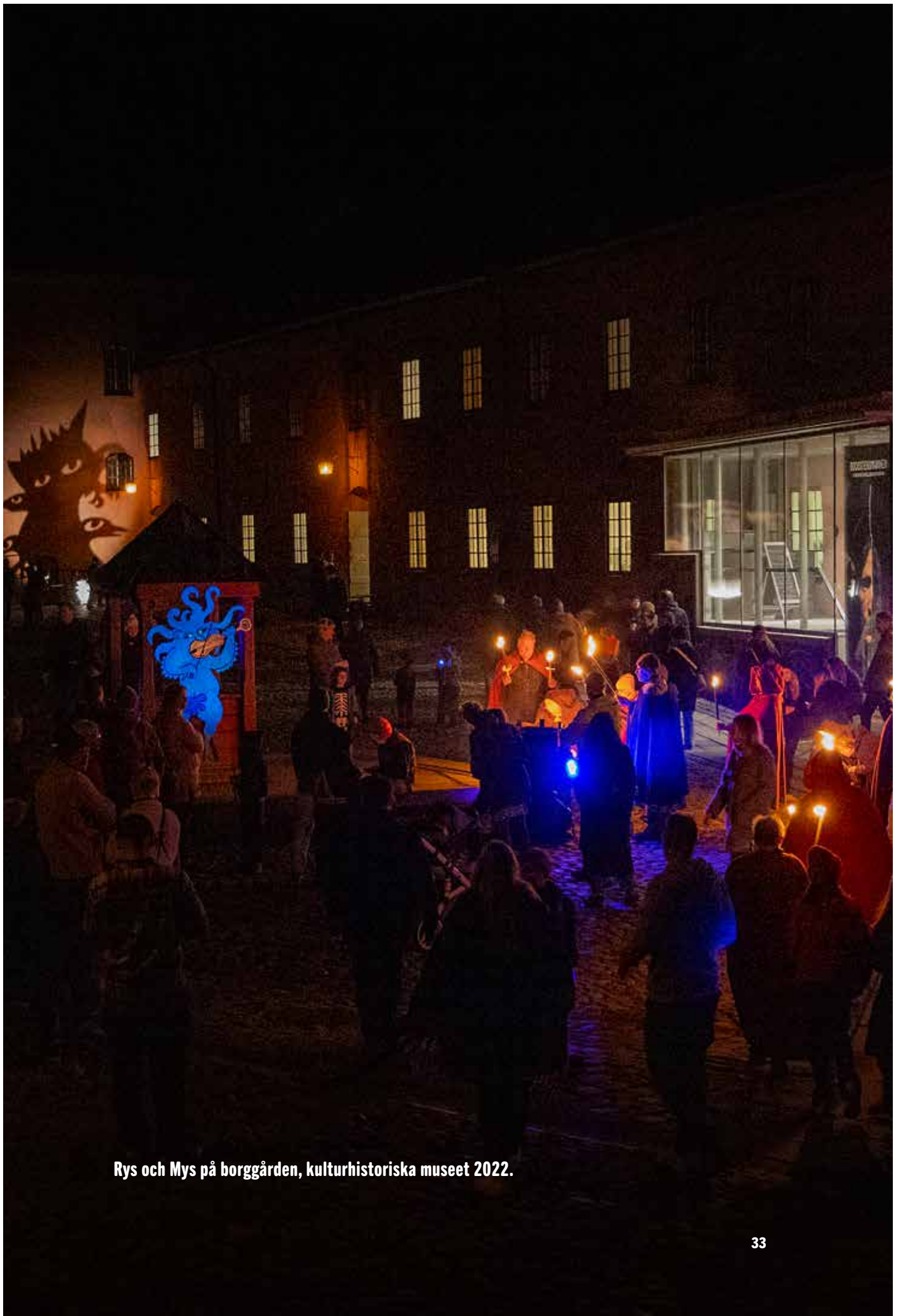
Rys och Mys på borggården, kulturhistoriska museet 2022.